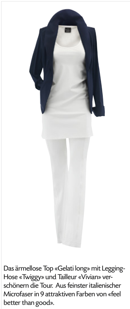
Das ärmellose Top «Gelati long» mit Legging-Hose «Twiggy» und Tailleur «Vivian» verschönern die Tour. Aus feinsten italienischen Microfaser in 9 attraktiven Farben von «feel better than good».