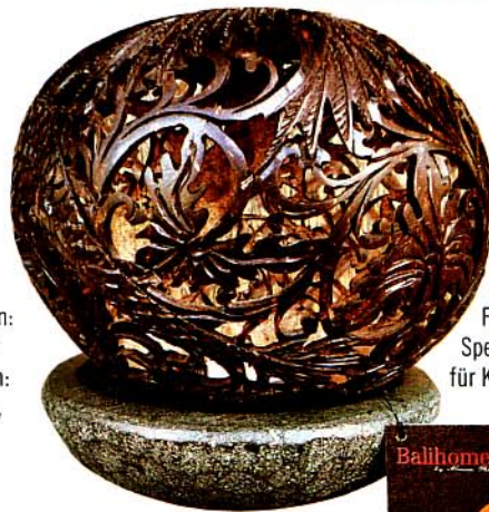
bali- home.ch, Fr. 160,-, davon Fr. 20,- als Spende für Kids