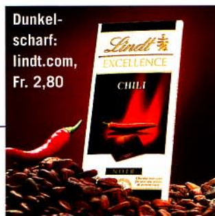
Dunkel- scharf: lindt.com, Fr. 2,80