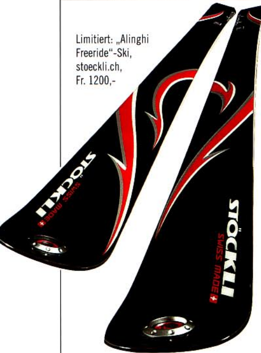
Limitiert: „Alinghi Freeride“-Ski, stoeckli.ch, Fr. 1200,-