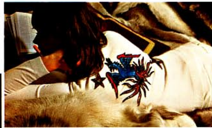
Fleece-Sweater Fr. 398,- (li.), Cashmere- Pulli Fr. 898,- (o.)