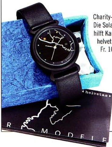
Charity-Aktion: Die Solar-Uhr hilft Kamerun: helvetas.ch, Fr. 109,-