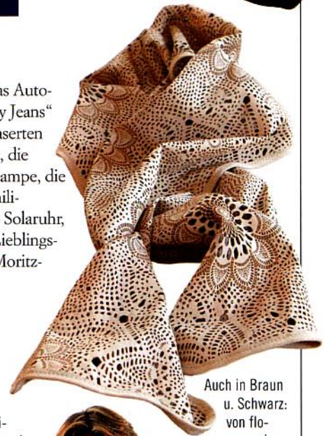
Auch in Braun u. Schwarz: von flo- accessoires. com, Fr. 398,-

Wer kriegt was? Für den Lieblingskollegen z.B. das Automuseenbuch, für die Liebblingsschwester „Pimp my Jeans“ von manor.ch, für die Lieblingsfreundin einen gelaserten Lederschäl, Wellnessmode für den Lieblingsmann, die Lieblingsnachbarin kriegt die balinesische Coco-Lampe, die Liebblingsschoggi-Freundin schmilzt bei heisser Chili-Schokolade, das Lieblingspatenkind bekommt die Solaruhr, der Lieblingsbruder den Alinghi-Ski. Und unser Lieblings-Ich verwöhnen wir mit der allerersten coolen St.-Moritz-Mode (online, schnell da!): stmoritz-store.ch